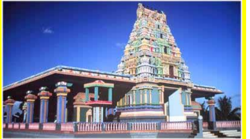
பெரிய கோவில். ஸ்ரீ சிவ சுப்பிரமணிய ஆலயம், நந்தி, பீஜி