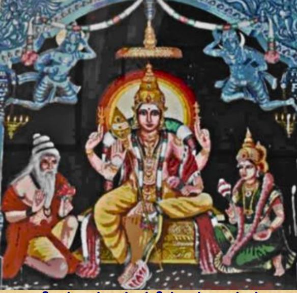
திருப்பரங்குன்றத்தில் சுப்ரமணியர் இடப்புறத்தில் தெய்வயானை உடனிருக்க, வலப்புறத்தில் நாரத முனிவர் உள்ளார்

அங்கு தங்க முடிவெடுத்ததும் உடனேயே விஸ்வகர்மாவை அழைத்து தனக்கும் தன்னுடன் வந்துள்ள அனைத்து தேவர்களுக்கும் தங்க வேண்டியதற்கான அற்புதமான இடத்தைக் கட்டுமாறு ஆணையிட்டார். அது மட்டும் அல்ல அந்த இடத்தை சுற்றி நல்ல சாலைகளையும் அமைக்குமாறு கூறினார். தங்களே சூறையாடிய அசுரன் சூரபத்மனை சுப்ரமணியர் அழித்ததின் நன்றிக் கடனாக அவருக்குத் தன் மகள் தேவசேனாவை அவருக்கு திருமணம் செய்து கொடுக்க ஆசைப்பட்டார். அங்கு கூடி இருந்த பிரம்மா மற்றும் விஷ்ணுவிடம் அவர் தன் ஆசையைக் கூற அவர்களும் அதைப் பெரும் மகிழ்ச்சியுடன் வரவேற்றனர். அது குறித்து அவர்கள் சுப்ரமணியரிடம் கூறியதும் அவரும் அதை ஏற்றுக் கொண்டபின் கூறினார் “ தெய்வயானையும் இமயமலையில் உள்ள சரவணப் பொய்கையில் அதை எதிர் பார்த்தபடி வேண்டிய வண்ணம் இருக்கின்றாள்” .