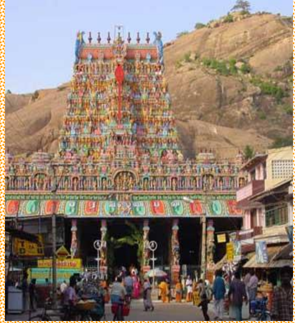
திருப்பரங்குன்ற கோபுரமும் மலையும்

தன்னுடைய கடமையான சூரபத்ம சம்ஹாரத்தை திருச்செந்துரில் முடித்துக் கொண்டு, அவனால் பல்வேறு சித்திரவதைகளுக்கும் ஆளாகி இருந்த தேவர்களே விடுவித்துக் கொண்டு அவர்களுடன் சுப்பிரமணியர் அங்கு வந்தார். அவர் அங்கு வந்து சேர்ந்ததும் பராசர முனிவரின் மைந்தர்கள் அவரை அன்புடன் வரவேற்றனர். அவர்களுடைய வேண்டுகோளை ஏற்றுக் கொண்டு அவர்