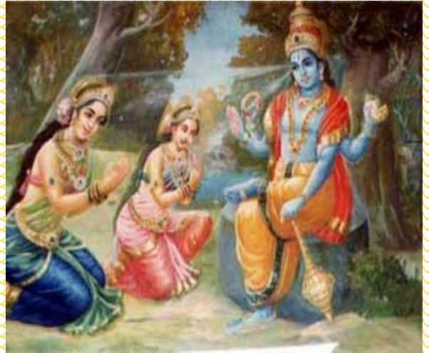
சுந்தரவல்லியும், அமிருதவல்லியும் தங்களுடைய தந்தையிடம் முருகனை திருமணம் செய்து கொள்ள வரம் தரும்படிக் கேட்டனர்.

சுப்ரமணியர் சம்மதத்தைத் தெரிவித்ததும் அபு மலையில் இருந்த தன்னுடைய மனைவி இந்திராணியையும், மகள் தெய்வயானையையும் அழைத்து வருமாறு தன் தூதுவனை அனுப்பினார். திருப்பரங்குன்றத்தில் நடக்க இருந்த திருமணத்திற்கு தேவையான ஏற்பாடுகள் செய்யப்பட்டன. சீதை, பார்வதி முதல் அனைத்து தேவ தேவதைகளும் வந்திருந்து தெய்வயானைக்கும் சுப்ரமணியருக்கும் ஆசி கூறி வாழ்த்தினர். அது முதல் அந்த இடம் புகழ் பெற்ற சுப்ரமணிய ஸ்தலமாக மாறியது. சுப்ரமணியர் கண்டவீர்ப்பு என்ற இடத்தில் தங்கி இருந்த பொழுது மகாவிஷ்ணுவின் இரண்டு புதல்விகளான அமிருதவல்லியும் சுந்தரவல்லியும் தங்களுக்கும் சுப்ரமணிய கடவுளுடன் திருமணம் நடக்க வேண்டும் என்று ஆசை கொண்டு சரவணப் பொய்கைக்கு வந்து தங்கி தவம் இருந்தனர். அவர்கள் தவத்தை மெச்சி அவர்கள் முன் காட்சி தந்த சுப்ரமணிய கடவுள் அமிருதவல்லியை நோக்கி “ நீ இந்திரனின்